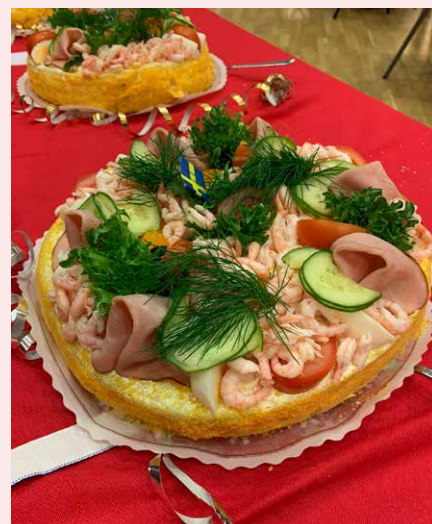
Alla gäster bjöds på smörgåstårter.

Sedan starten 2012 är det många som fått chans till praktik i byggprojektet. Flera av boendebyggarna från den första etappen jobbar idag på bygget och handleder de nya praktikanterna. Just nu är boendebyggare nummer 97 och 98 inne i projektet, och vi ser fram emot att kunna fira när vi kommer upp i hela 100 boendebyggare.