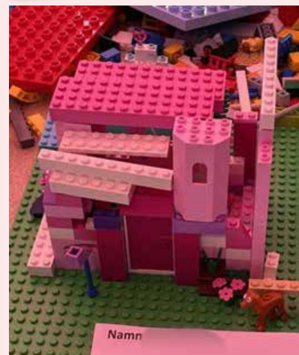
Vinnarna i ÖBOs Legotävling.

dagen! Enbart tre byggen kunde dock få pris och slutligen korades dessa tre verk som dagens vinnare. Grattis till vinnarna och bra kämpat alla barn!